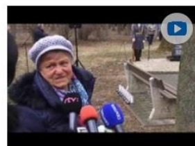
12 rokov od výbuchu