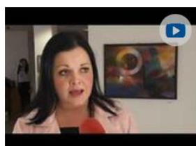
Budú verejnú diskusiu