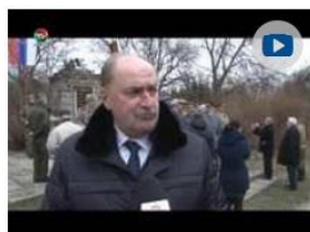
Pietna spomienka v obci Cetuna