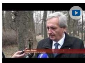
V novákoch si uctili obeť výbuchu