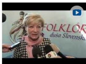
Podpora tradičnej kultúry