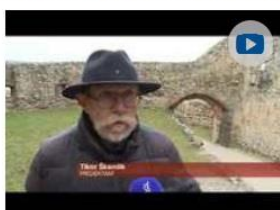
Rekonštrukcie na Trenčianskom hrade pokračujú

Reportáže regionálnych televízií z diania v Trenčianskom samosprávnom kraji.