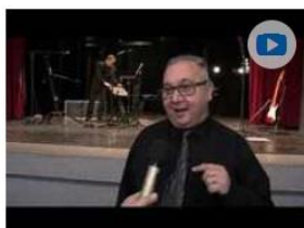
Tradícia koncertov k MDŽ