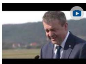
Prievidza má zmodernizované letisko