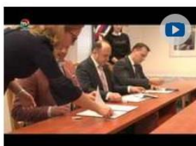
Podpis zmluvy s Bankou