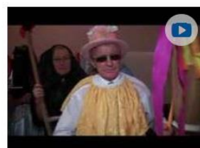
SZPP ukončil fašiangovú sezónu

Príspevky v regionálnych televíziách mapujú dianie a aktivity Trenčianskeho samosprávneho kraja a organizácií v jeho zriaďovateľskej pôsobnosti, ako sú osvetové strediská, galérie, hvezdárne, knižnice, múzeá, stredné školy, jazykové školy, školské zariadenia, zariadenia sociálnych služieb, zdravotnícke zariadenia a pod. Sú vysielané v premiére a následne v reprízach aj v dňoch pracovného voľna a pracovného pokoja. Odvysielané príspevky Trenčiansky samosprávny kraj zverejňuje aj na svojom webovom sídle, kde sú priradené k tlačovým správam a fotogalériám z predmetných podujatí a akcií.