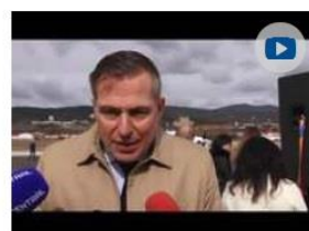
Dvere do sveta otvorené